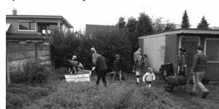
Rodičia a učitelia brigádujú.

Dňa 29. septembra 2014 sa na školskom dvore uskutočnila brigáda, na ktorej sa zúčastnili rodičia a učitelia materskej a základnej školy na čele s pánom starostom. Natrel sa premiestnený detský autobus, mreža na učebni. Spoločne sme vyčistili priestory v časti školského dvora, kde bude postavená telocvičňa. Ďakujeme všetkým zúčastneným za ich voľný čas a ochotu pomôcť. - MŠ a ZŠ -