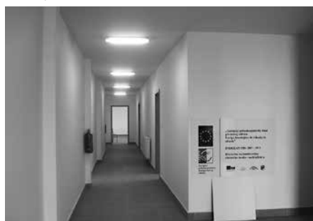
Nové priestory obecného úradu

Návštevníkov nových priestorov zaujímali ďalšie tri otázky, na ktoré sme zisťovali odpovede. Najčastejšou otázkou bolo využí-