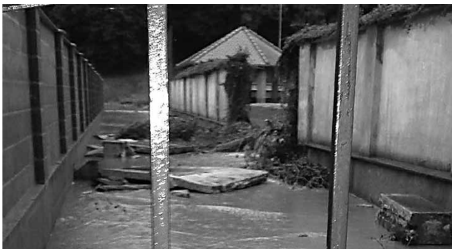
Záplavy v Jablonovom

Voľakedy mali ľudia v dedine skúsenosti s valiaccou sa vodou, ktorá v prípade vytrvalých alebo výdatných dažďov stekala z okolitých svahov. Aby sa ochránili, po obci, v chotári aj v sadoch boli urobené a udržiavané jarky, rigoly a žľaby. Dnes si mnohí ľudia v dedine priečhody a priepusty zaviezli alebo zasypali a nedali do nich prietokové rúry. Vo viacerých prípadoch kanály nemajú odtoky, alebo nie sú vyčistené a upchávajú sa. Pri týchto septembrových povodniach voda nemala kade odtekať, tiekla na cestu a hneď do niektorých záhrad a pivníc. Keby neboli zasypané priepusty, vo viacerých prípadoch by sa to nestalo. Ľudia si tak spôsobujú problémy a škody nielen sebe, ale aj svojim susedom. Zachovať, obnoviť žľaby alebo ich poopravovať a udržiavať je v záujme ochrany vlastného majetku a bezpečnosti každého obyvateľa.