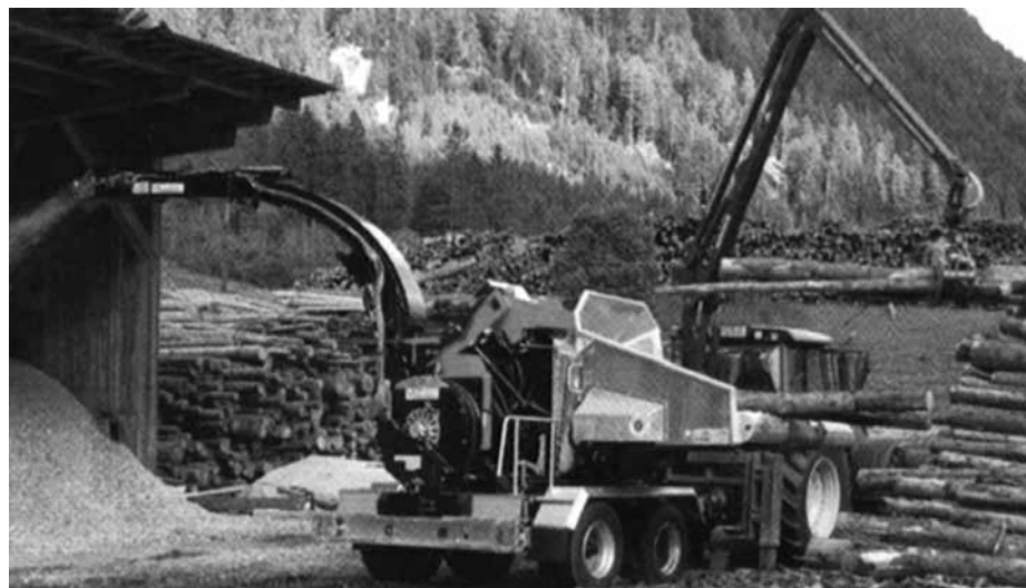
Ilustračné foto, zdroj. www.ilavcan.eu