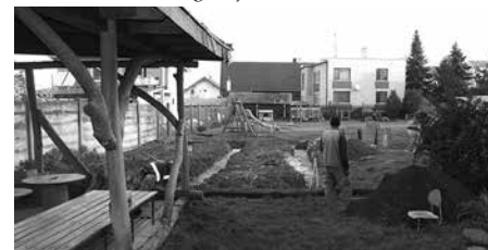
Na vyčistenej ploche sa stavia nová telocvičňa.