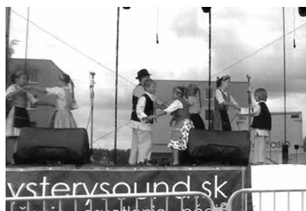
Vystúpenie DFS Jabúčko v Rohožníku