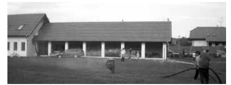
Ukážka zásahu na hasičskom výročí