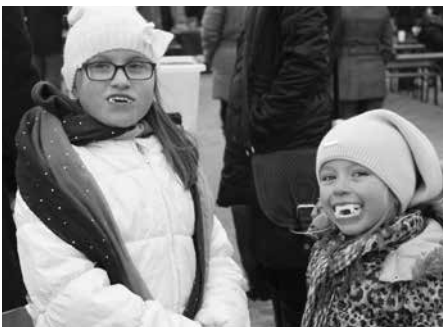
3. Súsedské vianočné trhy

Potešil nás i bohatý kultúrny program: vystúpenie folklórneho súboru Jabúčko, vianočný program detí z Materskej i základnej školy a vyvrcholením programu bolo spoločné vystúpenie detí a senioriek s betlehemskou tematikou o narodení Ježiša, pri našom prvom jablonačkom Betleheme. Ako sa vám páčil?