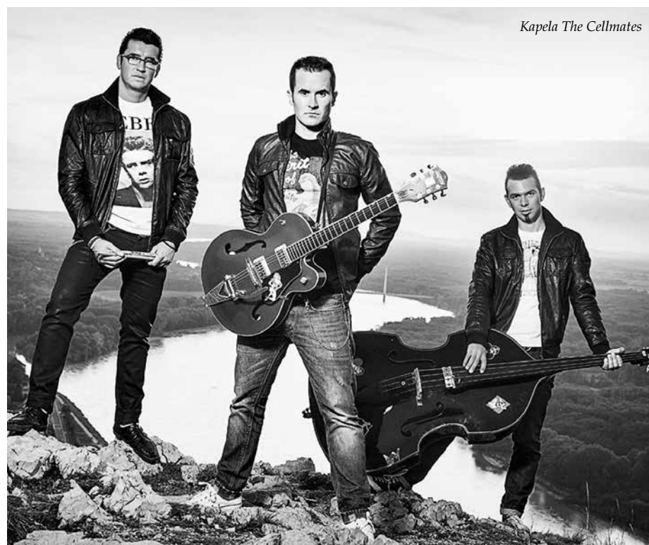
Kapela The Cellmates