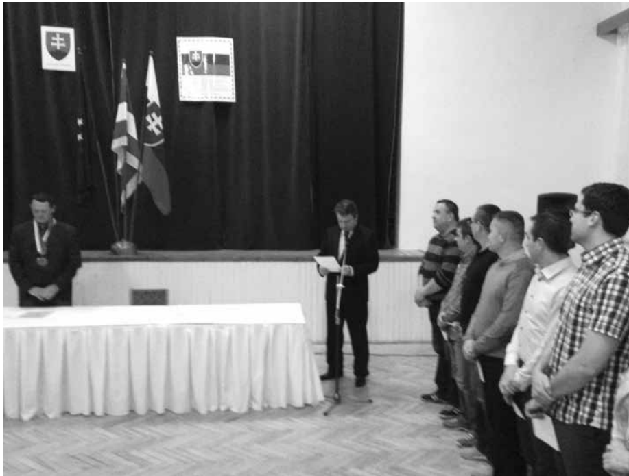
Skladanie sľubu poslancov a starostu na prvom ustanovujúcom Obecnom zastupiteľstve